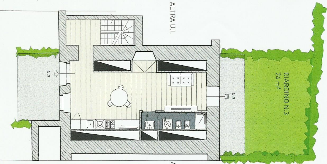
PIANTA PIANO TERRA S.U.L. = 62,4 m 2